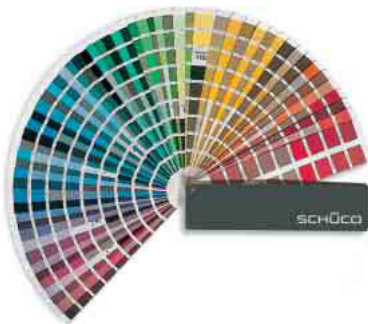
RAL- und Eloxal-Farben