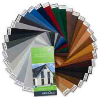
Schüco Farb- und Holzdekore