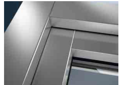
Erstklassige Gestaltungsvielfalt für Kunststoff-Fenster

Kunststoff-Fenster verfügen über die höchsten Wärmedämmstandards. Mit ihnen reduzieren Sie Ihre Heizkosten wesentlich, schonen dauerhaft Ihren Geldbeutel und leisten einen Beitrag zum Umweltschutz.